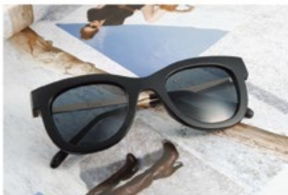
情境攝影 / 03