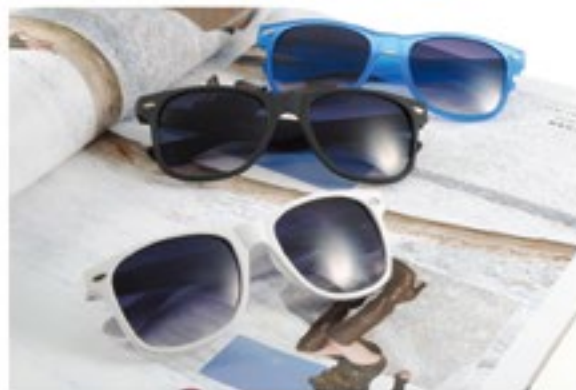
情境攝影 / 02