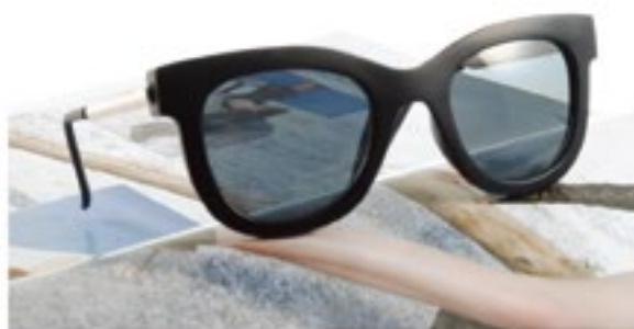
情境攝影 / 01