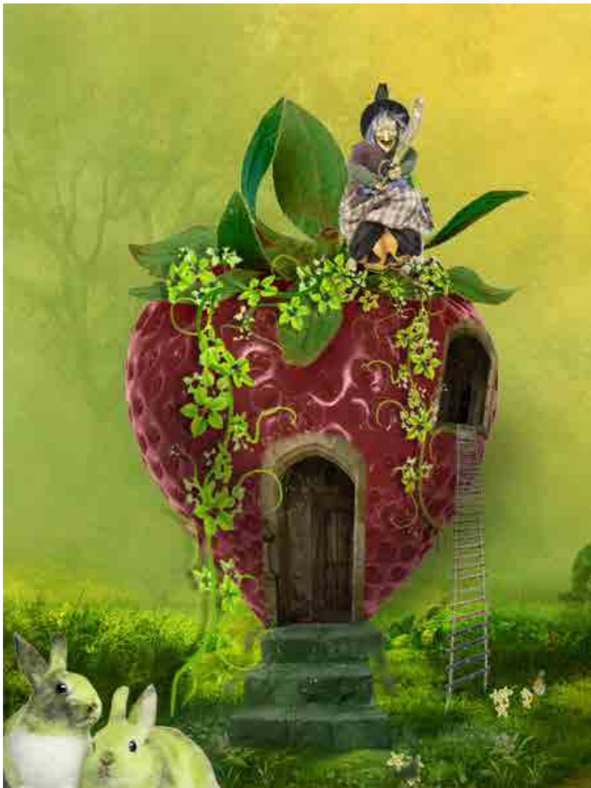
作品:童話風格合成作品