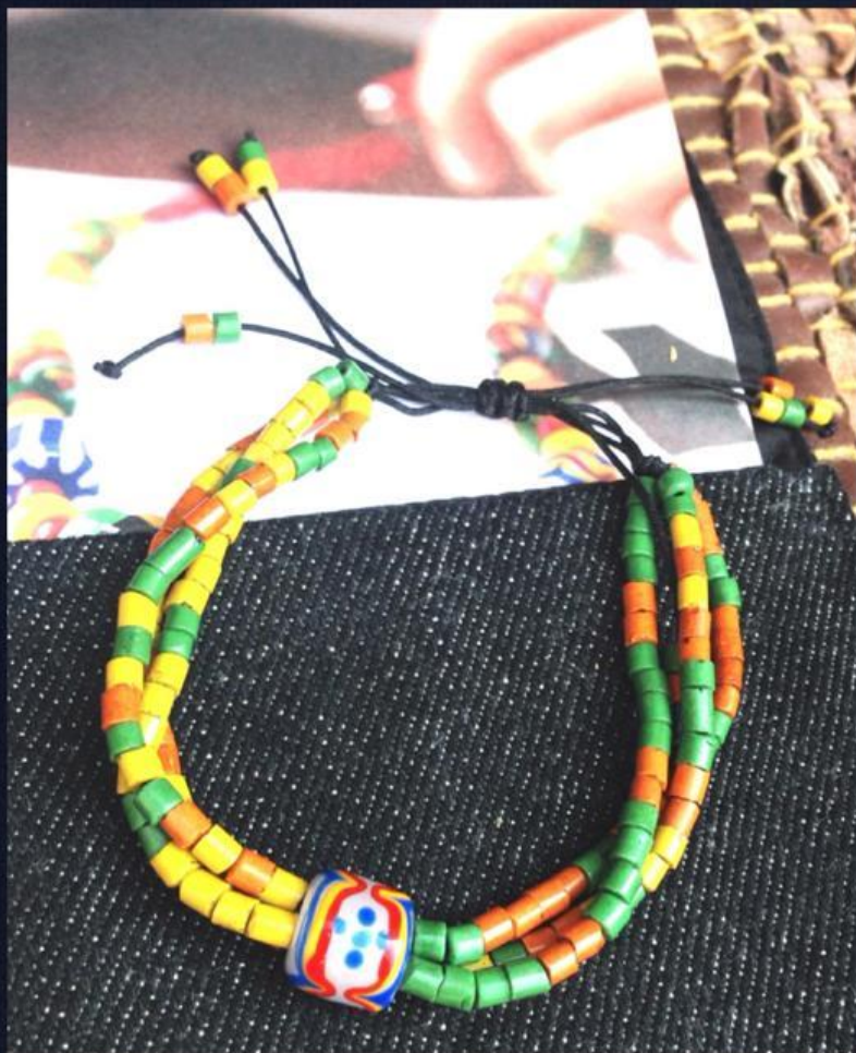
DIY串珠手鍊 / 台北松菸文創