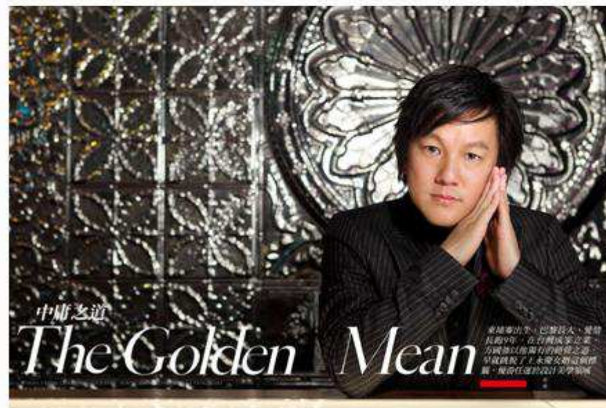
■ TAIWAN TATLER 2010 Mar.