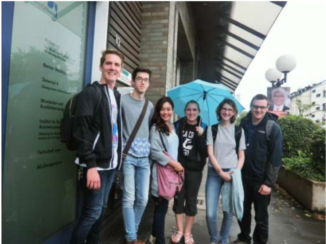
F. 體驗當地德國生活