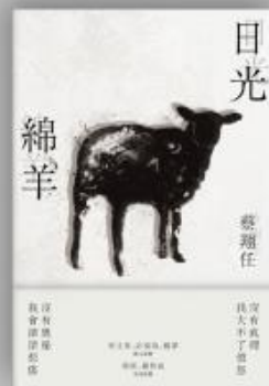
內封+書衣+書腰 (描圖紙)