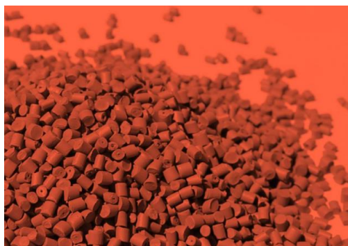
(附圖 3) 純天然樹脂(pure resin)

NARDI 堅守 30 年來不變的核心“ 商品是為了使人類的生活更好，是為了改變人類生活” ，因此避免在製造中以及產品完成後，產生無法回收所造成的廢棄物 (waste) ，NARDI 每樣家具皆使用百分之百純天然樹脂(pure resin，見附圖 3) 作為主要產品製造原料。