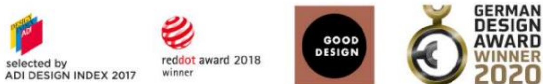
(附圖 1) NARDI 榮獲的四個國際大獎

中的古都 Chiampo，百分之百義大利製造的戶外家具品牌 NARDI 誕生在這個歷史文化重鎮。早在 30 年前就以品牌核心 -- 永續設計( Sustainable Design )/ 長青設計(Long Life Design)奠定品牌永續經營的根基與家具長青來改變人類的生活。以家具為媒介，熱烈的響應愛護唯一的地球，呈遞商品能持續被使用、長久的使用是非常重要的價值。並 80%的外銷至全球受到 115 國的客戶價值認同及四個國際大獎(見附圖 1)--ADI 設計指數獎(Adi Design Index)、紅點設計獎(Red Dot Design Award)、優秀產品設計獎(Good Design Award)及德國設計獎(German Design Award)。NARDI 不僅以美學及環境保護大使之名榮耀自己的國家--文藝復興起源之地義大利，更為世界和廣大美學、藝術、環境等渴望更健康更美好生活的使用者們，帶下先鋒性無法被取代的貢獻！