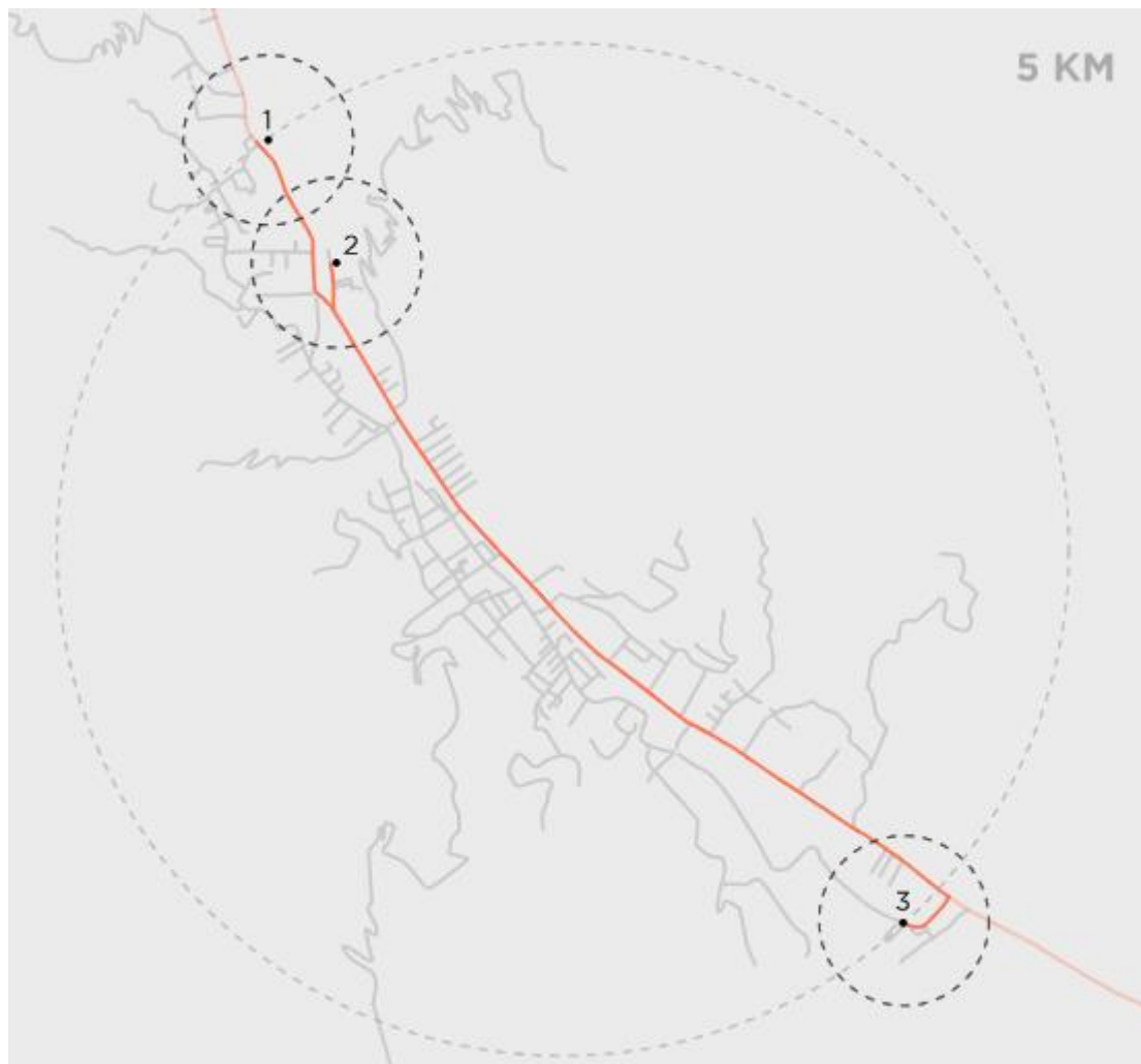
(附圖 2) NARDI 的三座工廠均在義大利，並皆在方圓 5km 內，達成效率運輸。

NARDI 不妥協的 30 年永續循環實踐，更是捷行健康家居總代理 NARDI 共鳴 的核心！捷行健康家居渴望與您，及您所愛的家人們一同創造真切的價值，成為 您家族故事的一部份！