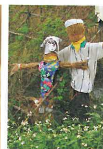
行健有機村合作社外可愛的稻草人