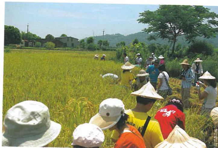
來行健村體驗農事的人們絡繹不絕