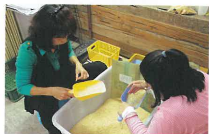
合作社員工們負責分裝、篩選稻米。