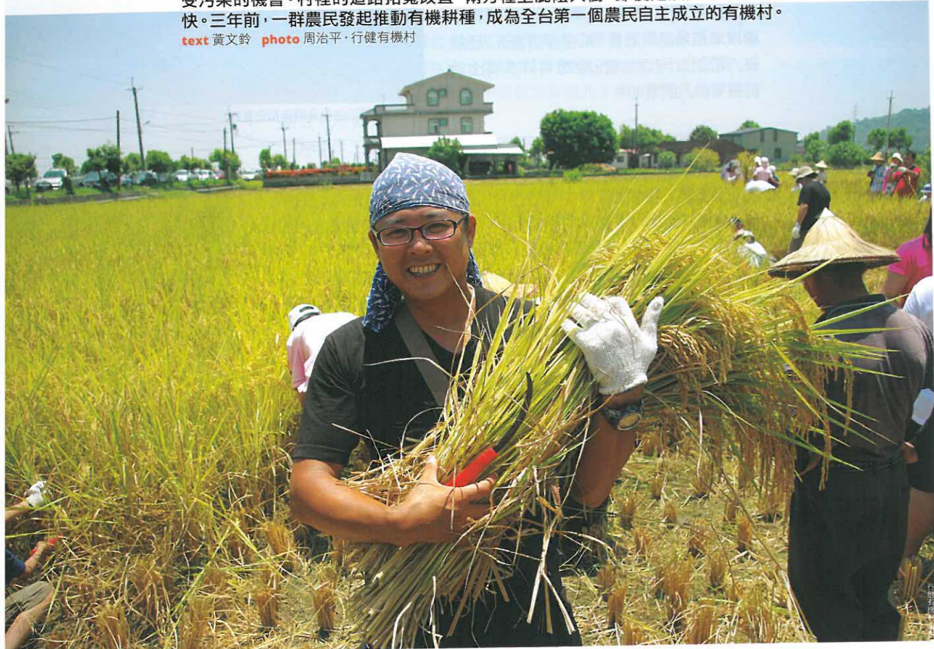
稻穀的遊客笑呵呵

大早來到行健有機村，這一天恰巧是村莊祭拜「三界公」誕辰的日子，虔誠的農民們每逢農曆正月十五、七月十五、十月十五都會到廟裡祭拜堯、舜、禹合稱的三官大帝，祈求今年農作豐收，家中平安。今年是三星行健村轉作有機以來第三年，儘管時序已入冬藏，稻田一片休耕的景象，仍有部份三星蔥田和冬季蔬菜田生意盎然地點綴其中。佇立在行健有機合作社前以稻草編織的大龍貓也高舉雙手招呼經過的遊客。