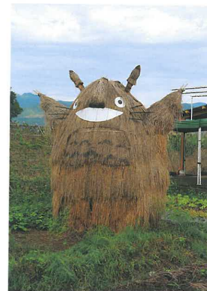
以乾稻桿作成的稻草龍貓，是行健有機村的大招牌。但在日前已遭不明人士燒燬。

第二、第三年合作社再加入幾位生力軍，原有農民也增加有機耕種面積，目前合作社成員多達22位，耕種面積達30公頃，佔行健村