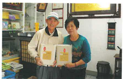
「坤潭伯」夫妻倆捧著自己種的有機米