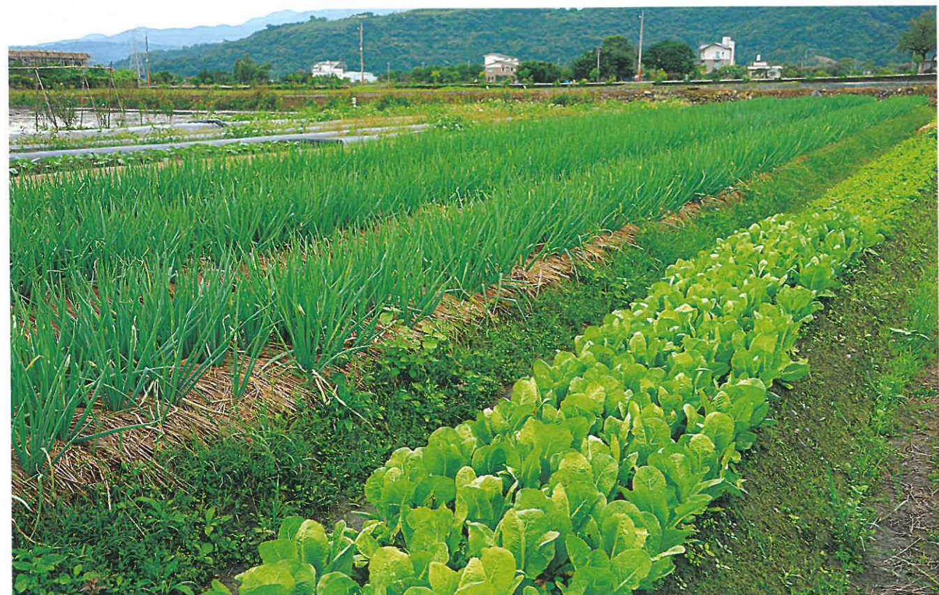
即使是冬天，行健村裡好幾塊蔬菜田仍生機盎然。