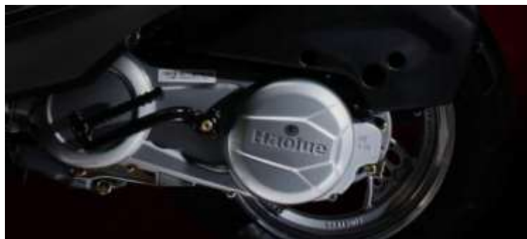
鷹鑽 三期歐規改版外殼造型