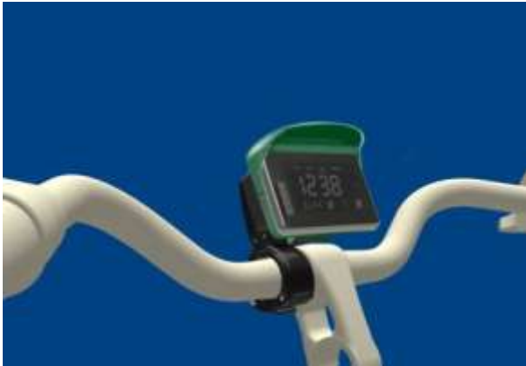
Dp09 電力腳踏車多功能display