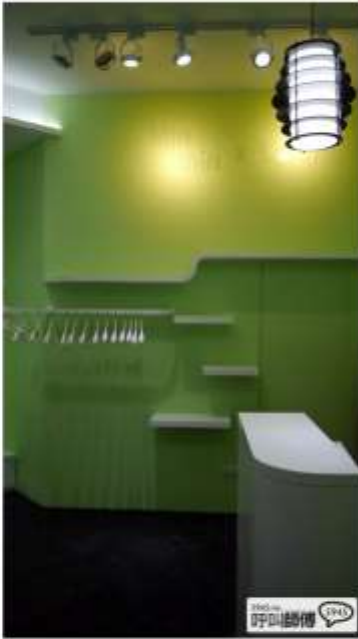
designed by C&C design

雖然整間服飾店區僅用了白、黑、粉綠三種主色，但透過線條、形狀的變化，能夠將原本毫無雜亂的店區重新翻轉，並且克服原本店面矮低且複雜的天花板結構，利用空闊的牆柱與形狀，搭配大量層架的使用，讓整間店面雖然坪數小，卻充滿變化與設計感，並拉近戶外與店內的距離，成功抓住消費者的目光。