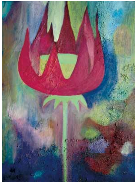
《阿凡達的蓮花》油畫 32cm x 41cm