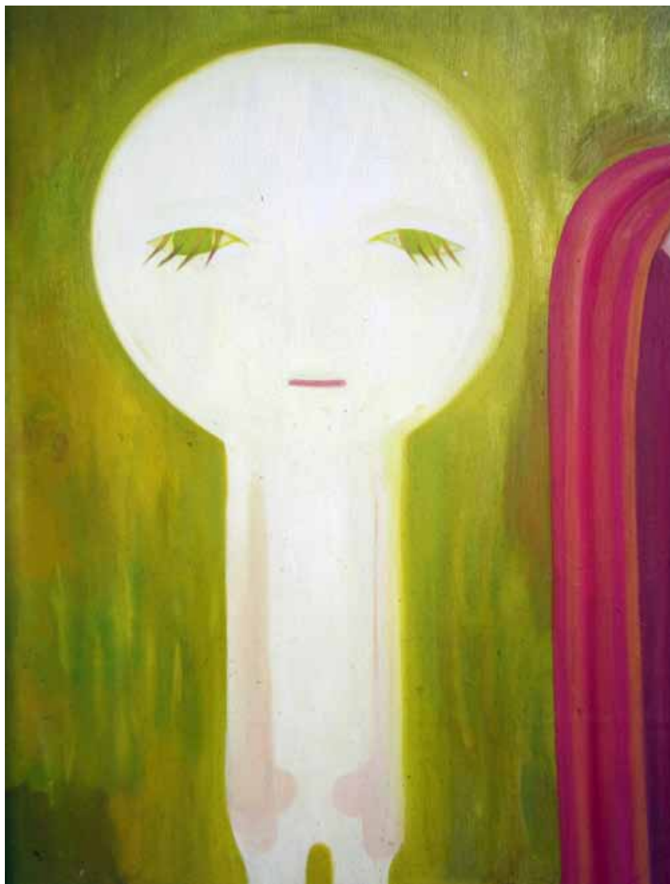
《機寶寶》 油畫 60cm x 80cm