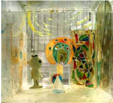
□ 30cm x 30cm x 30cm