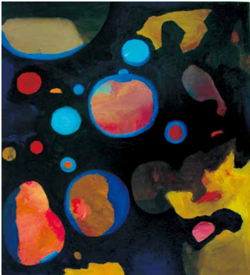
《宇宙》油畫 45cm x 53cm