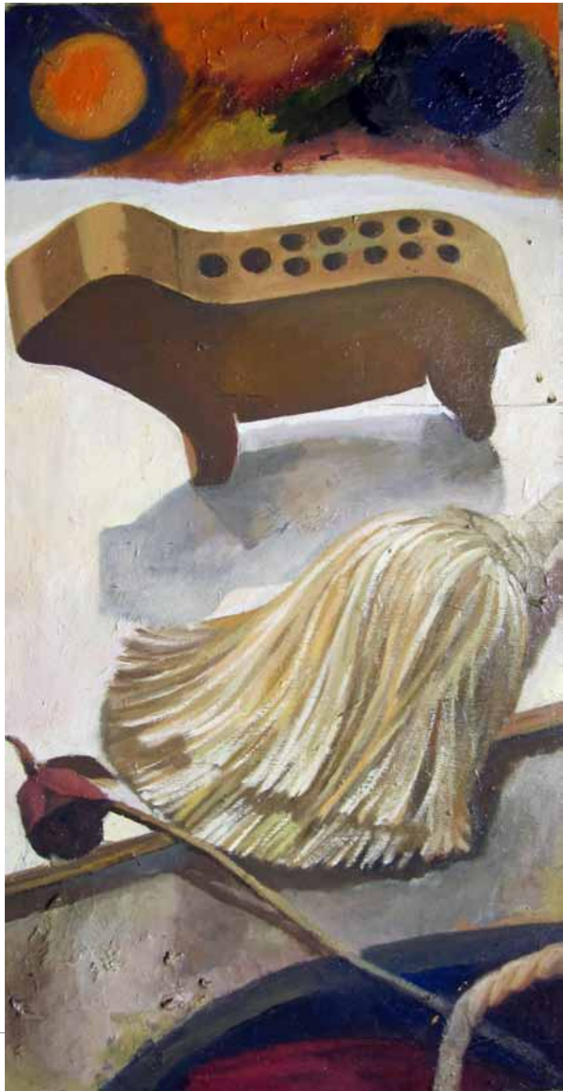
《奇幻世界》油畫 30cm x 60cm