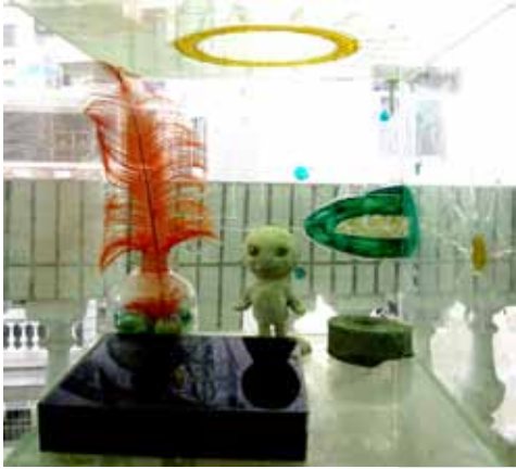
□ 30cm x 30cm x 30cm