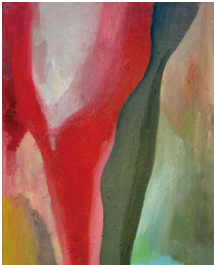
《通道》油畫 38cm x 46cm