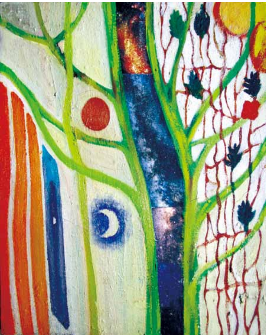
《哲研所》油畫 46cm x 54cm