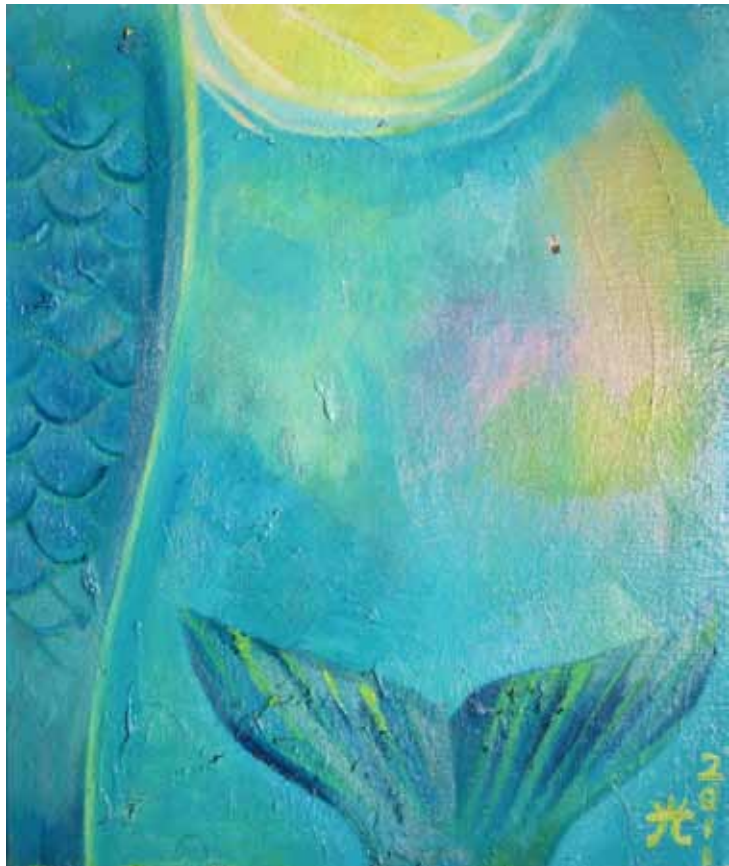
《陳隻魚》油畫 38cm x 46cm