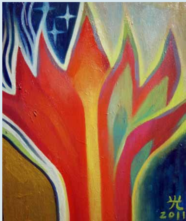
《塞浦路斯島的真火》油畫 38cm x 46cm