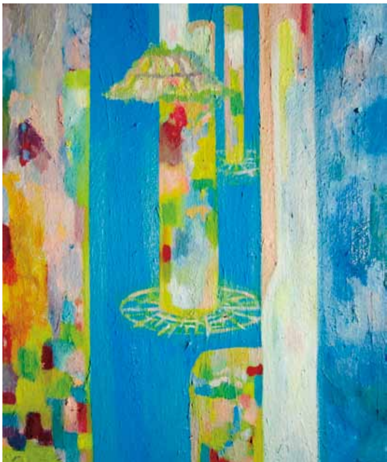
《天堂故鄉》 油畫 50cm x 61cm