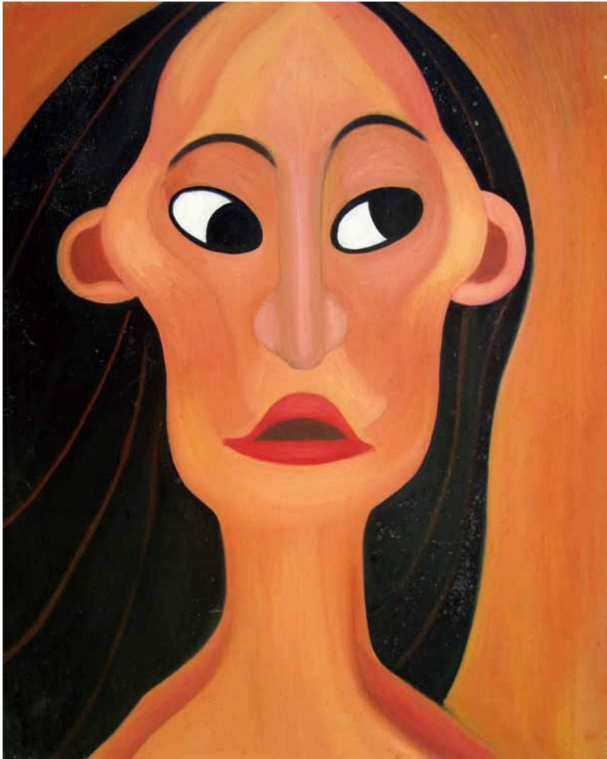
《奶媽》 油畫 73cm x 91cm