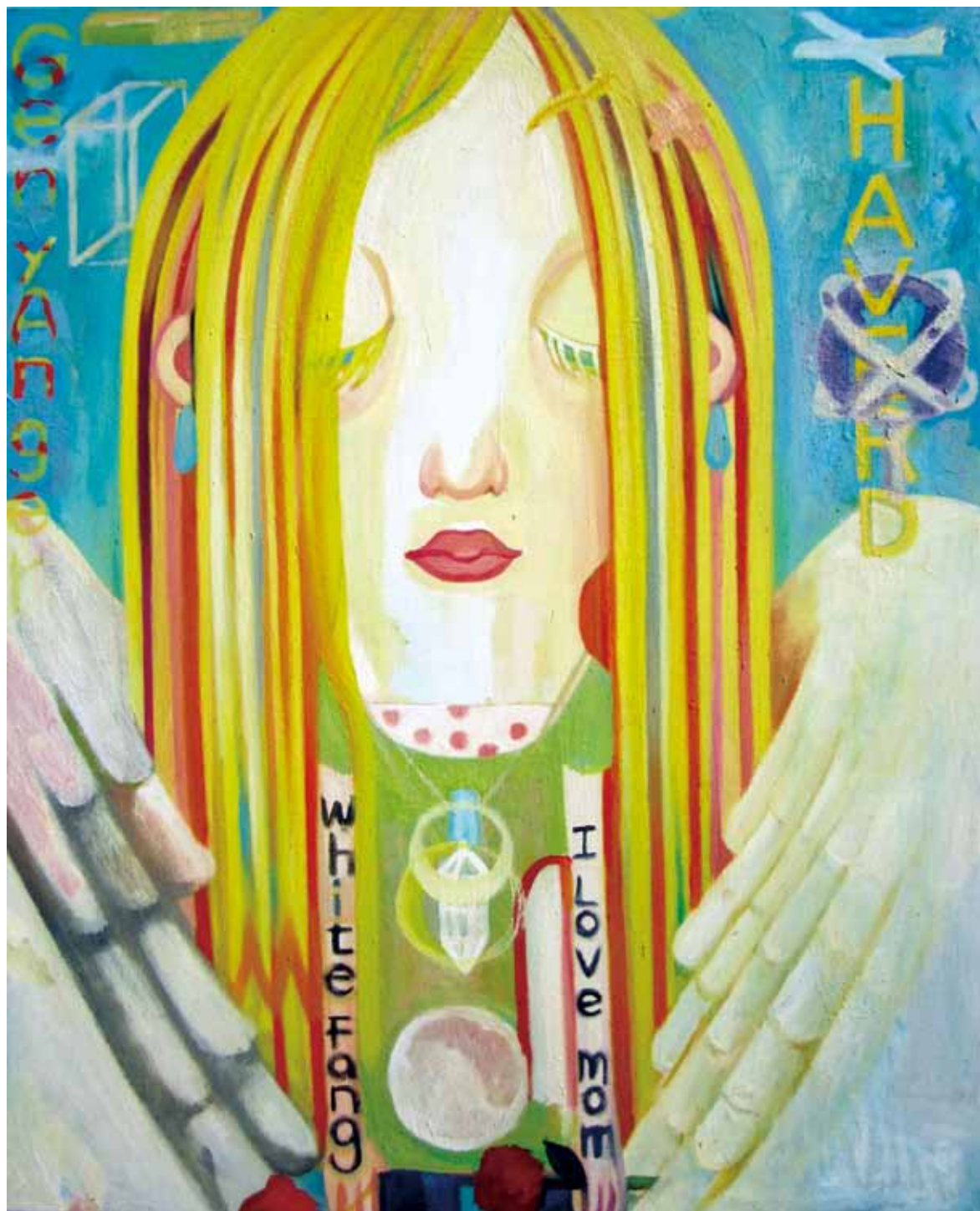
□ 《天使》 油畫 73cm x 91cm