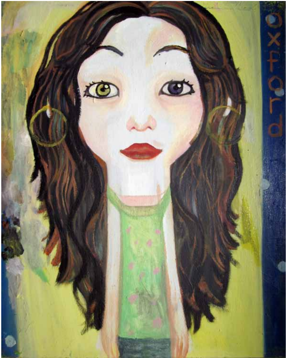
《外星人》 油畫 73cm x 91cm