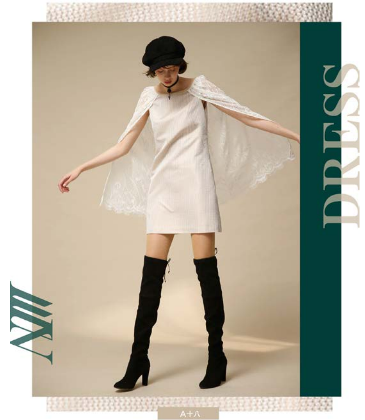
A十八 服飾海報2018AW 企劃/修片/編排