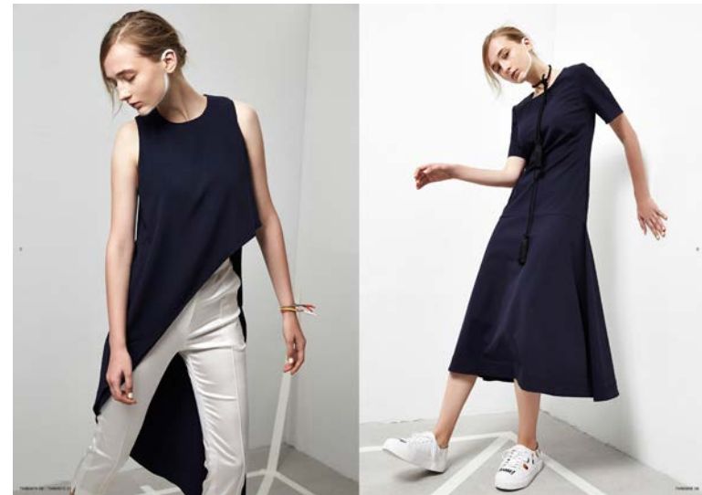
MOSDIORS 服飾型錄2017SS 企劃/修片/編排