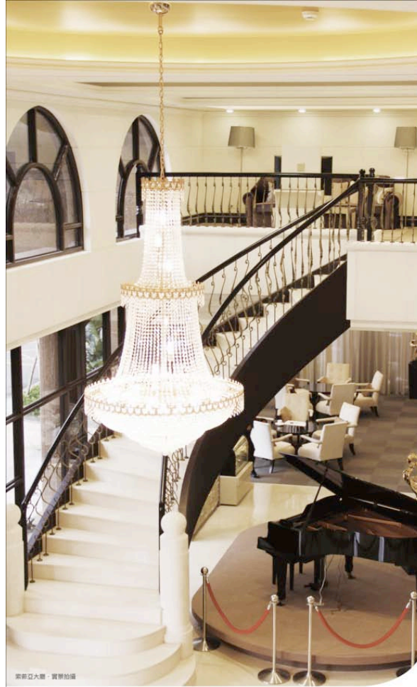
貴族大廳，實景拍攝