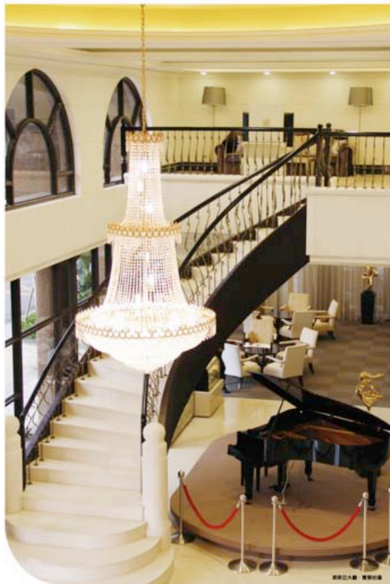
豪華大廳 貴賓套房

杜拜，位於阿拉伯聯合酋長國，是世界上最富有的城市之一。其建築風格獨特，充滿未來感。杜拜的建築業在過去十年中經歷了驚人的增長，這主要歸功於政府的投資和對基礎設施的重視。杜拜的建築業不僅吸引了大量的外國投資者，也為本地經濟的發展做出了巨大的貢獻。杜拜的建築業正在不斷發展，未來將會有更多的項目落地。