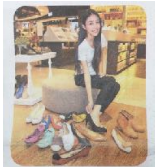
微風松高百貨獨家品牌Avivi，是2012年創立的網路品牌。