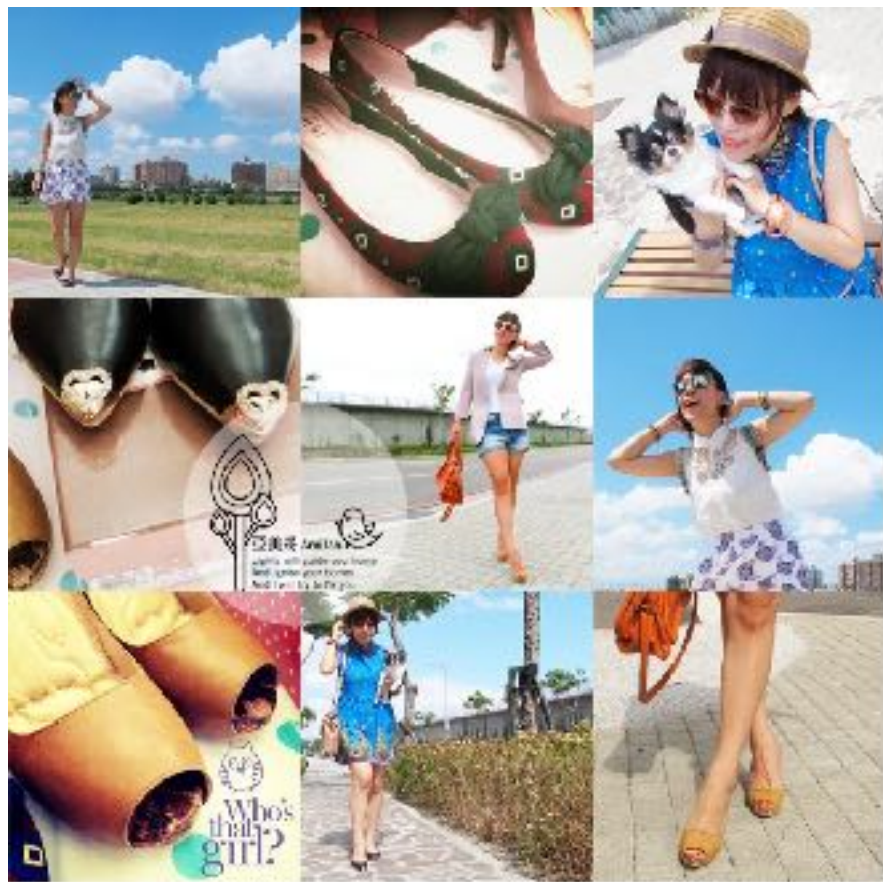
女人我最大 人氣部落客亞美將