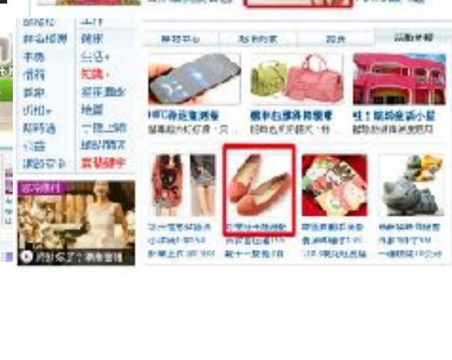
2013年2月進入YAHOO購物中心至今平均每個月鞋款被選中，在YAHOO入口首頁露出