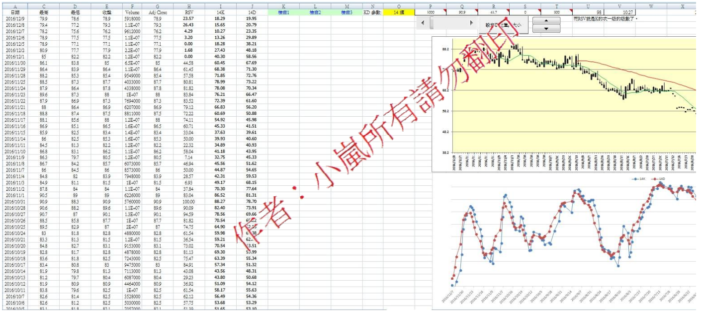
圖 5. 技術分析製作