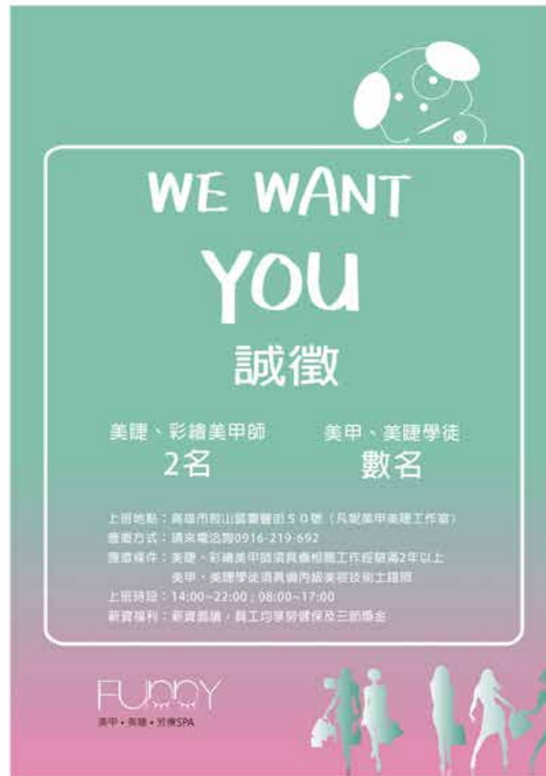
FUNNY 凡妮美甲工作室 | 尺寸:A1 人才招聘海報