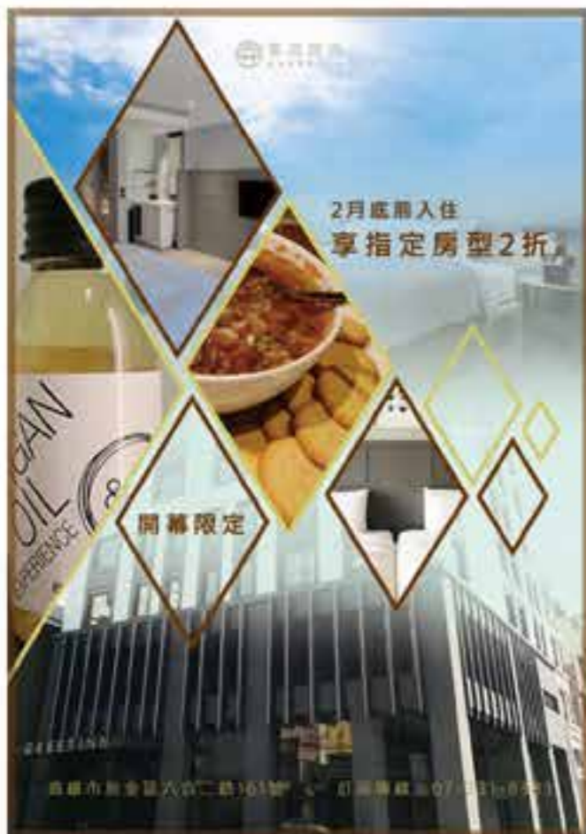
Greet Inn | 尺寸:A1 開幕促銷海報