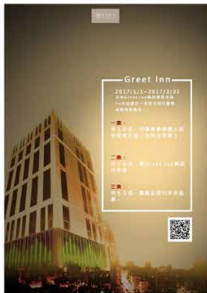
Greet Inn | 尺寸:A1 抽獎活動海報