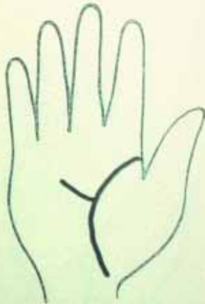
具財運和經商才能

多國家設有手相專門的學校，從事學術研究，可見手相學不但不是無稽的迷信，而且深受人類重視的程度了。