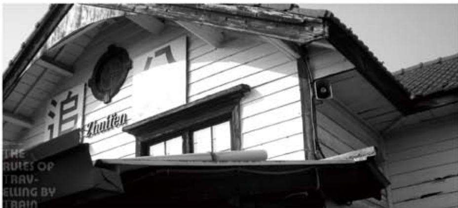
縱橫旅行 追分火車站 臺灣鐵路海岸線最南端車站

在某種程度上，升為旅客輸運及行包運送，其中旅客輸運自民國八十六年（西元一九九七年）起新車加入營運，運能大幅提升，營收日趨成長；惟九〇年因國道3、4號的相繼通車，九十二年（西元二〇〇三年）又受SARS影響致稍有下降，九三年（西元二〇〇四年）起車票旅客及營收已回復。