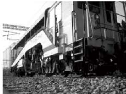
左上圖：車站站房 右上圖：當時停於車站的 工程機車