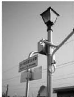
THE RULES OF TRAVELLING BY TRAIN

西元二〇〇〇年前後，台灣名片式吉祥車票世紀大熱賣，「追分成功」（金榜題名）、「追驛成功」（有情人終成眷屬）亦掀起熱潮，讓追分、成功與成追驛名聲一時。