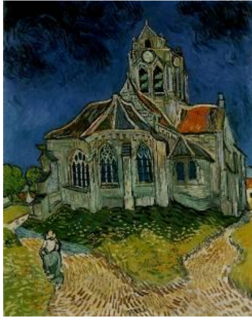
奧維的教堂〔The Church at Auvers〕1890