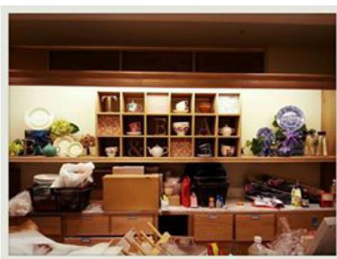
百貨樓層活動合作-快閃店設計