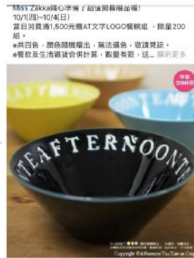
你 - 游龍真真 1,002人 4個留言 15分分享