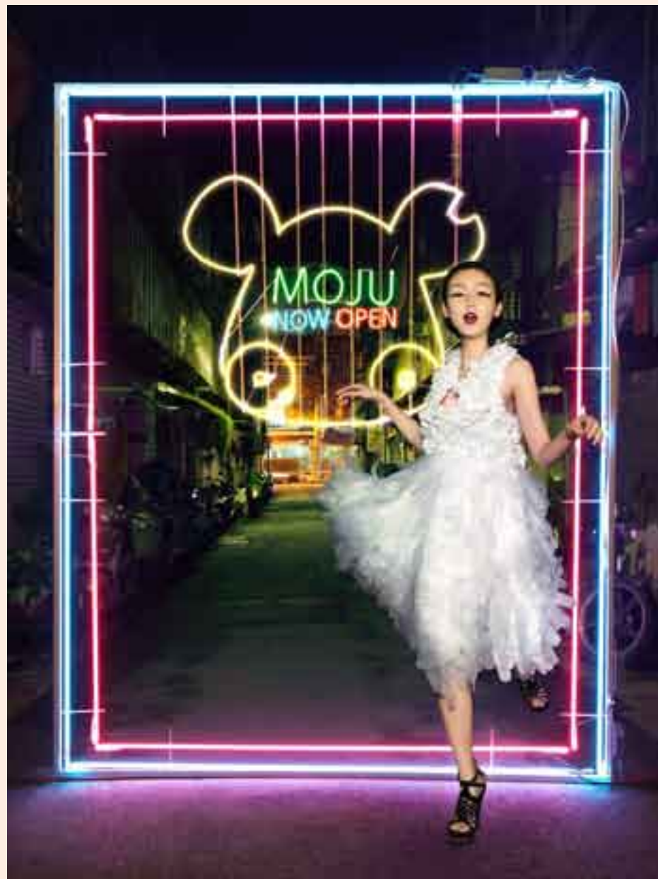
尋找20隻黑貓 當代藝術攝影展