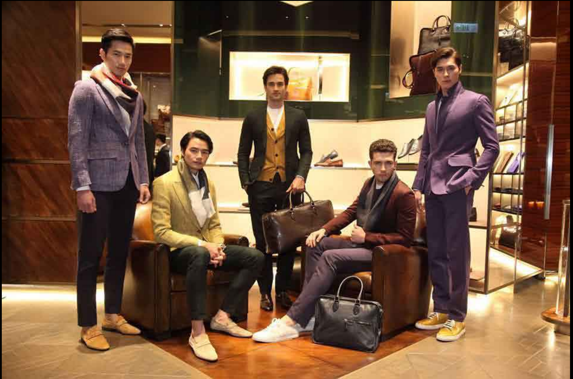
Berluti 15ss in store trunk show