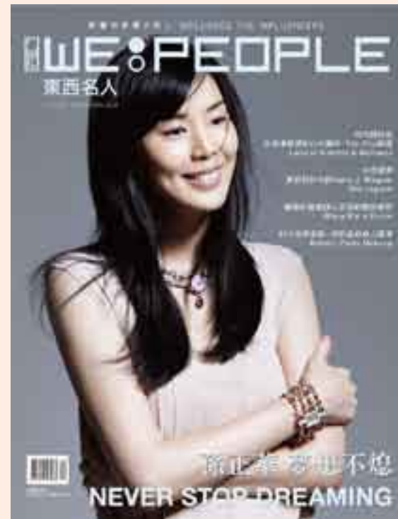
WE PEOPLE 東西名人 封面