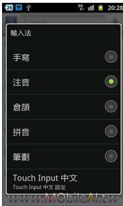
輸入法介面示意圖