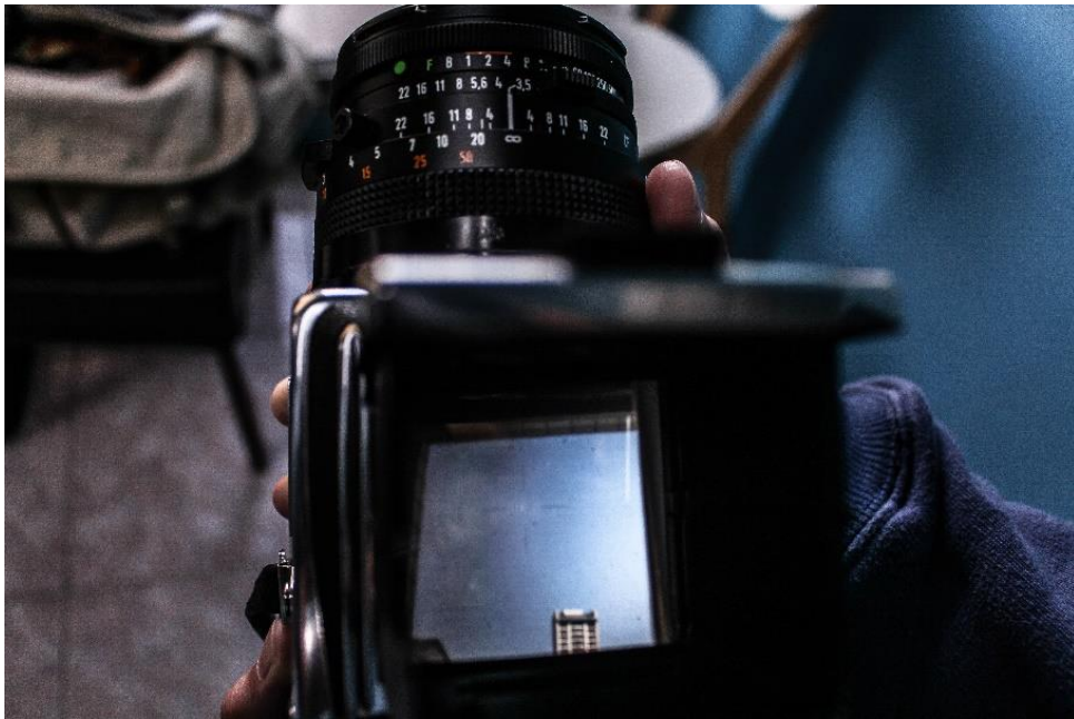
融駿近期使用的相機(Hasselblad 500cm)，透過光學投射而看到影像，觀景窗與鏡頭垂直

而他也與我們分享，他有個朋友會開始接觸底片攝影，是因為學生時期想要拍比較大片幅的東西，而全片幅的數位相機又比較貴。底片相機能拍得片幅比較大，入門的花費也比較低。也有些朋友是因為拍膩了數位，拍出來總是一成不變的作品，而想換換口味，開始接觸底片。所以對於預算有限或是想嘗試新東西的攝影同好，底片相機是不錯的選擇！