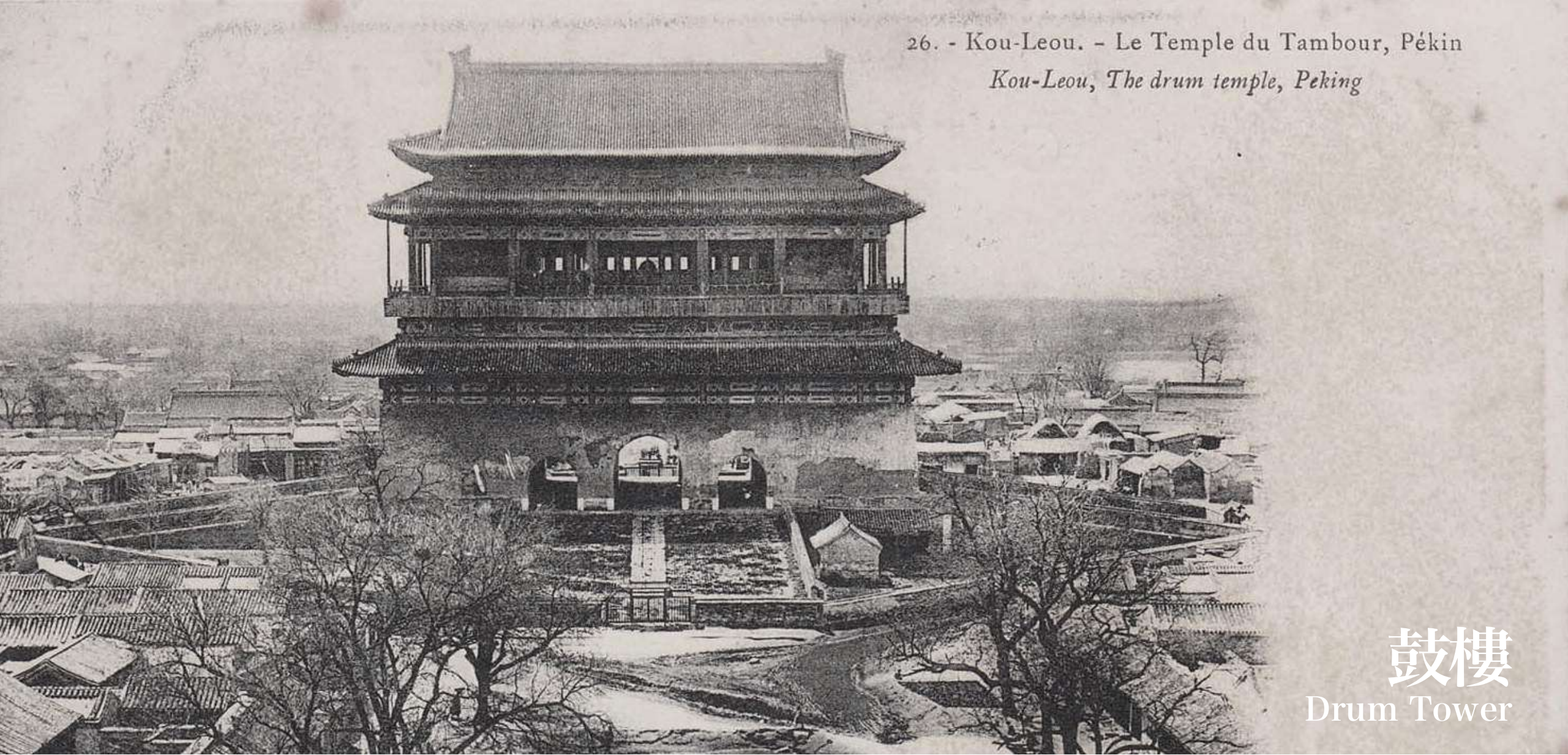
鼓樓 Drum Tower