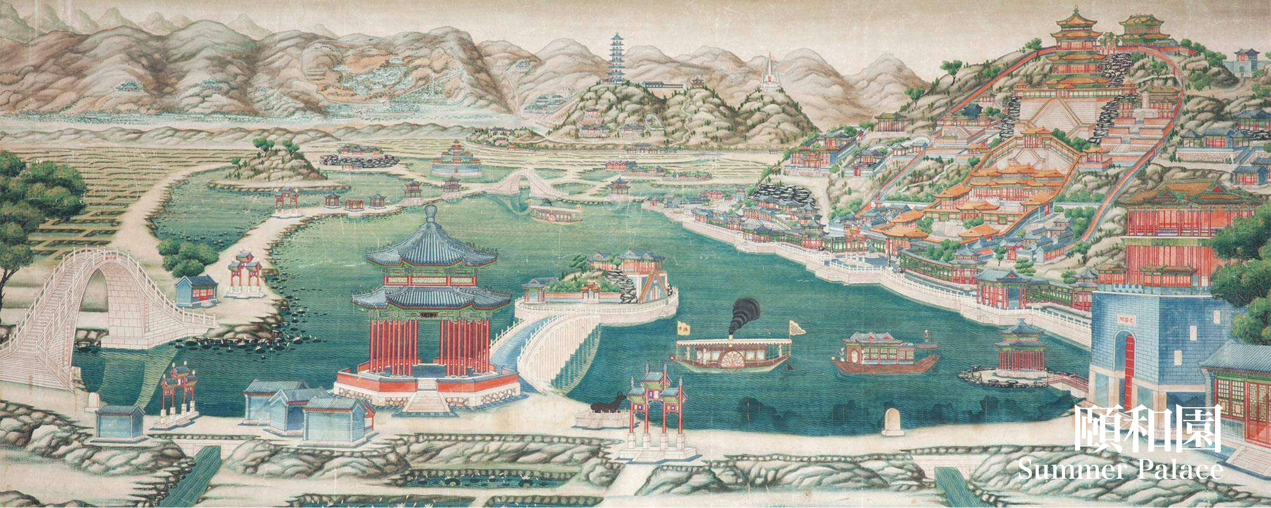
頤和園 Summer Palace