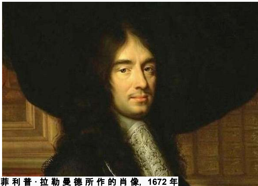
菲利普·拉勒曼德所作的肖像, 1672年