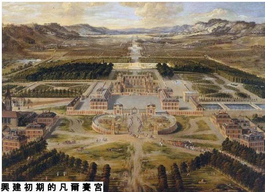
興建初期的凡爾賽宮