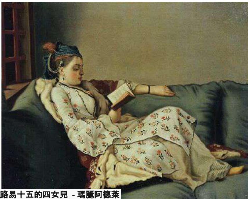
路易十五的四女兒 - 瑪麗阿德萊