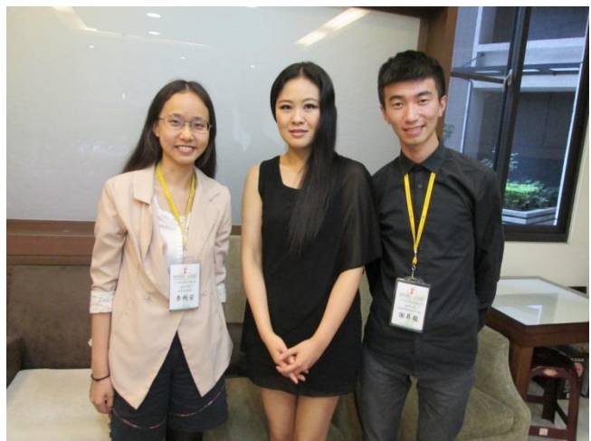
(圖為 2014 年採訪十大傑出青年合照)