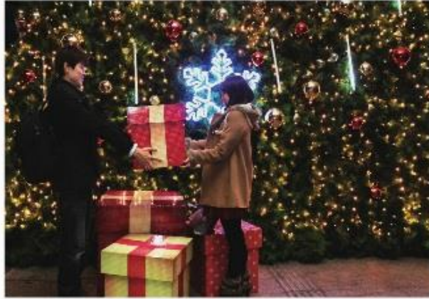
撰文 / 李佩蓉