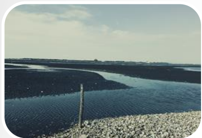
蚵農們用蚵殼填 海造陸