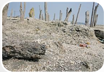
蚵殼造成環境問 題