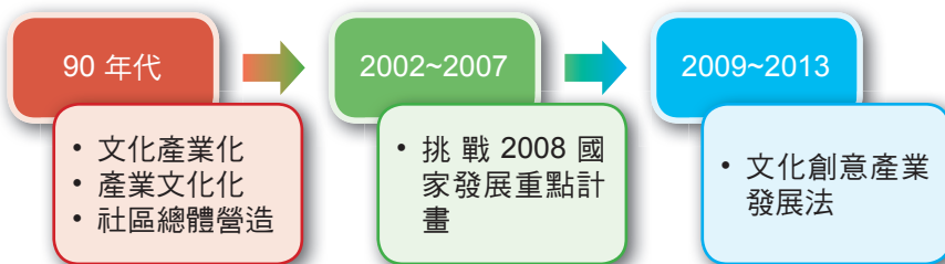
圖 1-1 台灣文創產業的發展

最 近有個有趣的廣告，廣告中的小朋友利用電腦簡報跟父母說明讓他養狗的理由，同樣的道理，了解了文化創意產業在過去的豐功偉業及未來的無限可能之後。身處在台灣的你我，更應該了解政府對該產業的態度，免得要跟家長解釋時，卻不知從何談起，以下跟大家說明近期與文化創意產業較相關的政府政策，藉由歷史閱讀的方式，或許會讓人感受到政府的重視程度不斷的加乘。當然為了不讓大家把好不容易好像有點懂的文化創意產業又給複雜化，我們就簡單將文化創意產業在台灣的發展分成三個階段。