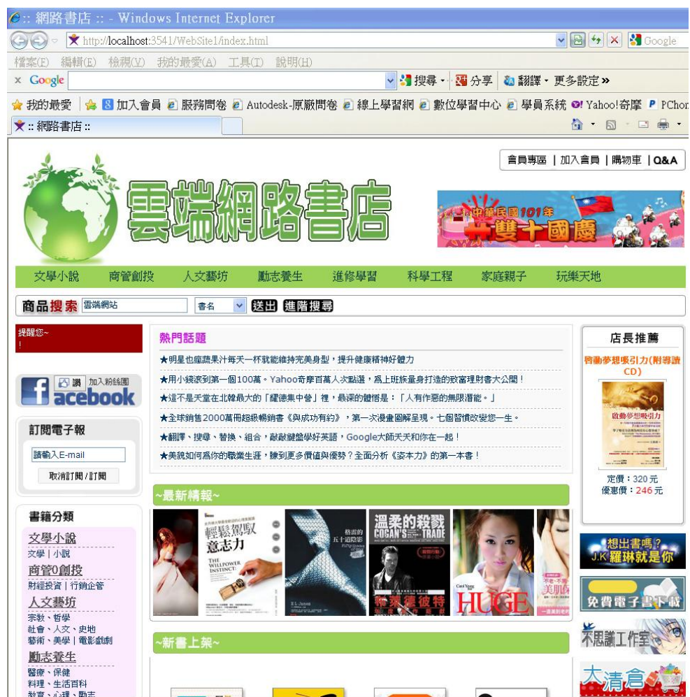
圖表 8、 http://www.nlb.com.tw/ 。