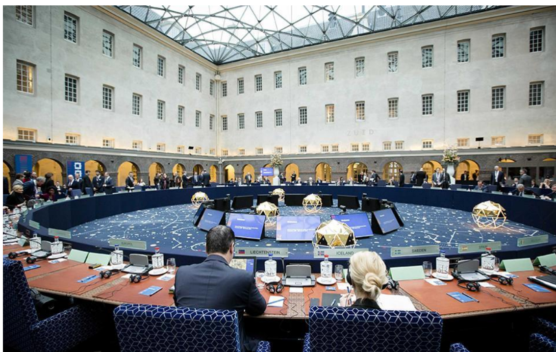
圖一：週一歐盟首長在阿姆斯特丹的會議

對於海路和陸路而言，希臘一直都是通往歐洲內陸的主要入口之一，上帝是公平的，擁有豐富海路資源的希臘，在此得到千年的經濟利益，但成也是它，敗也是它，去年統計，大約有一百萬的難民移入歐洲，歐盟也對雅典當局釋出善意，“款待”希臘的財政赤字帶來的脫歐危機，總是希望阮囊羞澀的希臘在處理內部財政之時，也多加強制止邊境的外來人口湧入，但是數據上還是力不從心，不減反增。