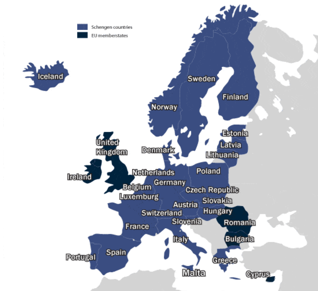
圖二：目前申根區列表

申根公約主要是歐洲國家之間的條約協定，主要是取消各國邊境的檢查，只要護照發有申根簽證，即可在申根國家區流動，無須再次辦理簽證，在落地的第一個申根區受檢，其後的過境國家則無須受檢。目前申根公約的國家有 26 個國家，其中有 22 個是屬於歐盟國家，希臘因為地屬海防邊境，比較特殊，一直拖延到 2000 年才加入申根區。從去年九月開始，申根區的會員國已經蠢蠢欲動，紛紛豎起邊防，開始內部邊境管制，按照先後順序大約為：德國、奧地利、瑞典、法國、挪威、丹麥。